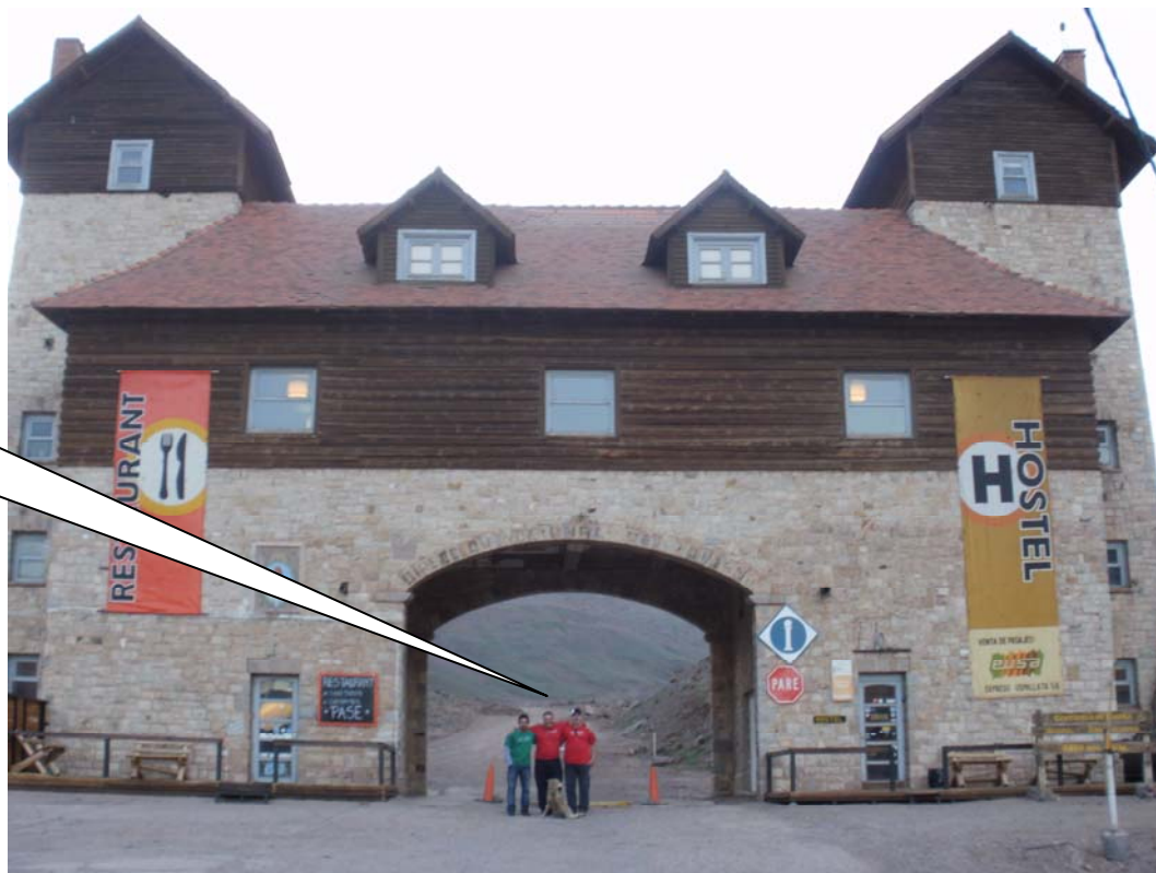
Arco de ingreso al camino al Cristo Redentor, Las Cuevas, Mendoza, Argentina

...los estamos esperando para comenzar nuestra aventura.